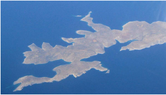
Insel Levitha - Südbucht