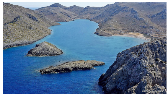
Prasonisi – Doppelbucht am Südkap von Rhodos